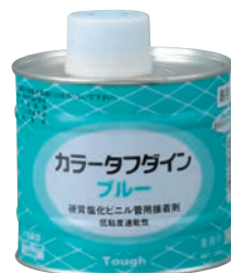
カラータフダインプルー 500g缶 粘度500mPa・s