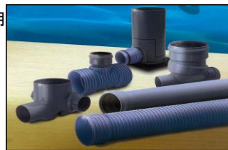
下水道用パイプ 下水道用マンホール継手