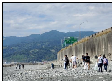
「浜海岸清掃」の様子