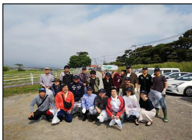
「クリーンさかわ」参加